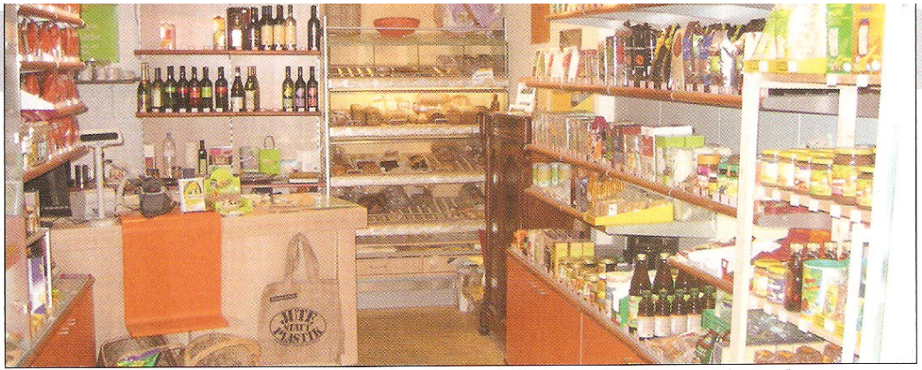
Alles für den Sternekoch fanden die Macher vom Fast-Food-Duell im Weltladen in Lichtenrade.

Regelmäßig kam Bolle. Er hatte bestimmte Halteplätze und eine große Schelle dabei, mit der bimmelte er lange und lautstark bis die ersten Kundinnen ihn erreicht hatten. Er war sehr beliebt, da es in der Viktoriastraße ja nicht so viele Einkaufsmöglichkeiten gab. Auch ein Brotwagen suchte die